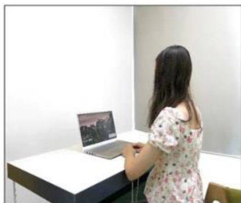
图3：侧后方第二机位效果图。

第二机位设备仅用于监控考试环境，请务必保证第二机位设备不会对面试造成干扰。如使用手机作为第二机位，应保证面试不被来电打断，须提前办理呼叫转移或免打扰。因手机使用造成掉线或者影响面试效果，后果由考生自行承担。