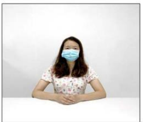
图2：正前方第一机位效果图。