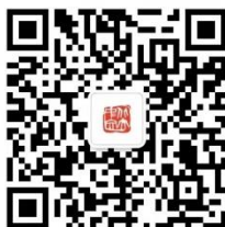
“北京大学中文系”微信二维码

请取得复试资格的考生安装微信应用，在 2023 年 2 月 11 日下午 17:00 前将“北京大学中文系”加为微信好友。加好友时须发送： 专业+姓名+身份证件号 ，方可通过验证。逾期不加好友的，影响复试联络通知，后果自负。